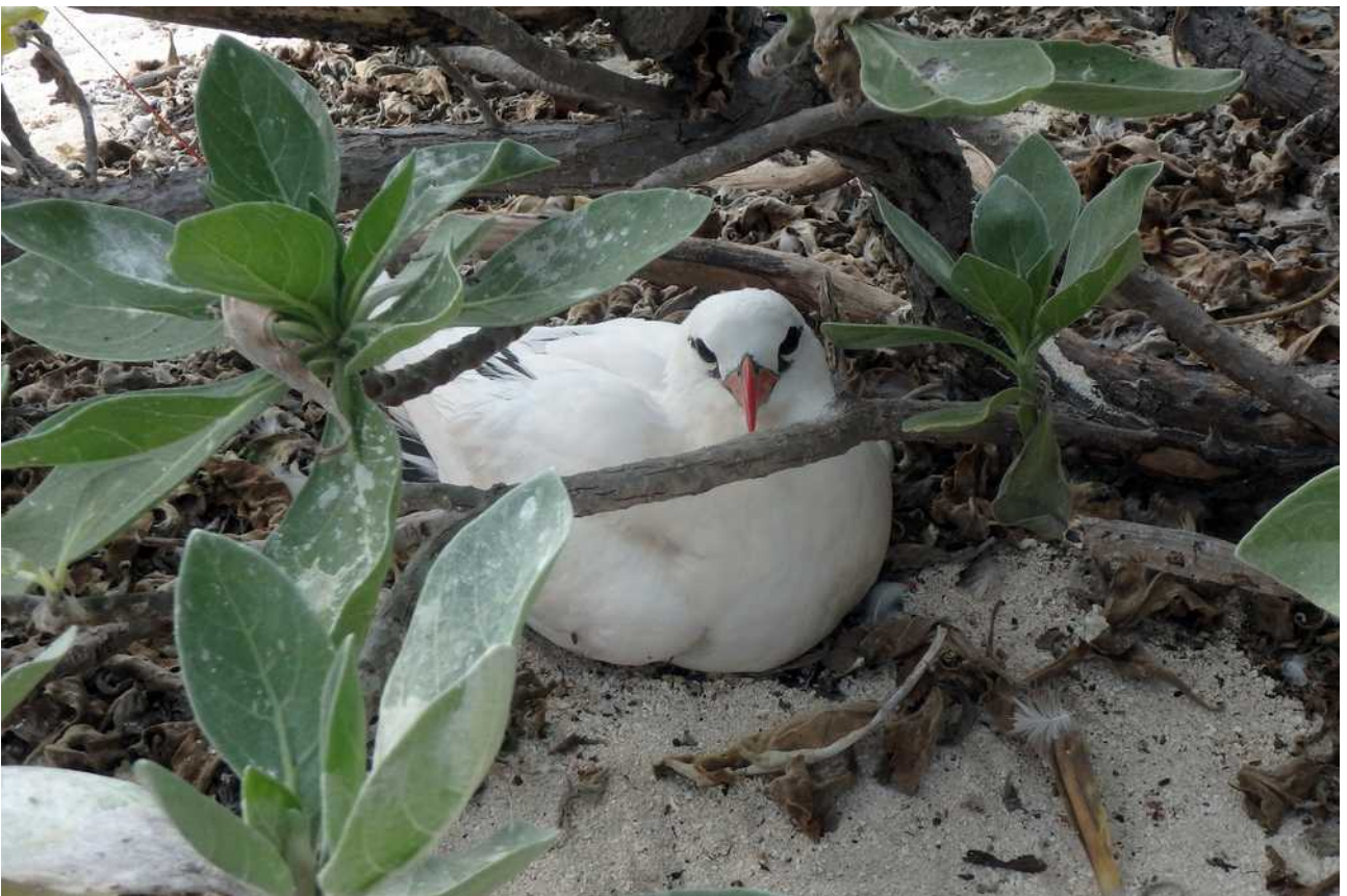
Een broedende kreeftkeerkringvogel