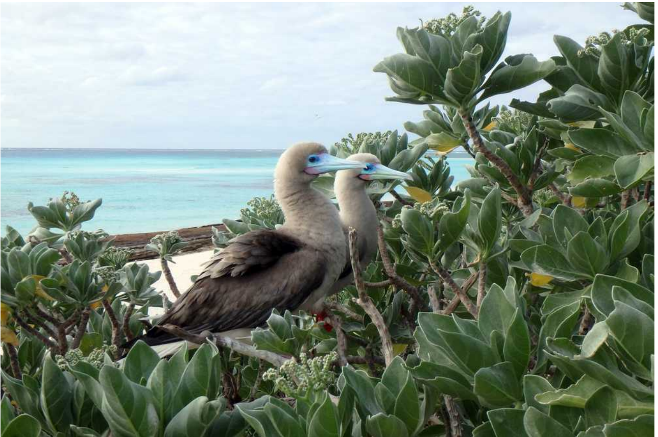
Red footed boobies in laag struikgewas op Herald Cay