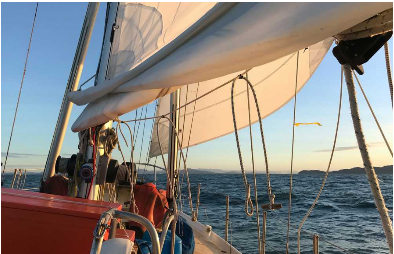
We naderen de kust van Australia met rechts Magnetic Island en Townsville voor ons

We liggen goed voor anker met voldoende ruimte tussen de andere jachten ook al roept mijn buurman op zijn 'plastic fantastic' ons onverstanebare aanwijzingen toe. De gele Q vlag voor quarantaine is al gehesen maar ik meld me nog niet. Stel dat ze op dit late uur nog aan boord willen komen, dan ben je meteen een fortuin kwijt aan overuren van de officials. De inklaring komt morgenochtend aan de beurt. We gaan eerst een nachtje goed slapen!