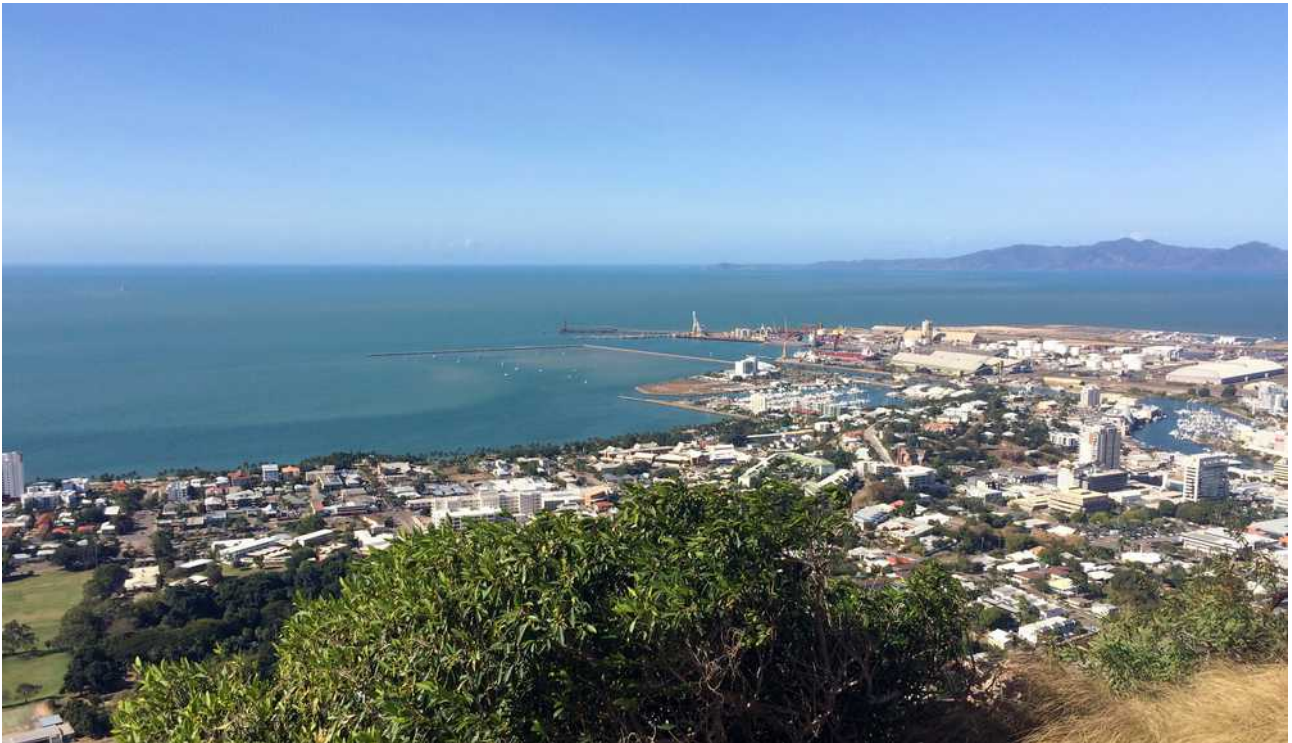
Townsville met de ankerplaats achter de pier naast de grote haven

Ik ben er de volgende ochtend al vroeg uit. Het is even wennen om in een grote haven te liggen. Geen mooie riffen maar grote pieren, geen diepblauw maar groen, modderachtig water, geen prachtige tropische bomen maar stalen kranen en loodsen en geen kindergeluiden maar geraas van verkeer! Via de marifoon maak ik contact met de jachthaven om te melden dat we klaar zijn voor de inklaring. Als snel krijg ik door dat we naar de 'fuel pontoon' in de jachthaven kunnen doorvaren. Landvasten worden opgediept uit het achteronder en stootwillen opgehangen. Ik kan me niet herinneren wanneer dat voor het laatst was.