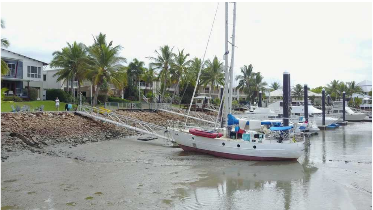
Weggezakt in de modder met laagwater